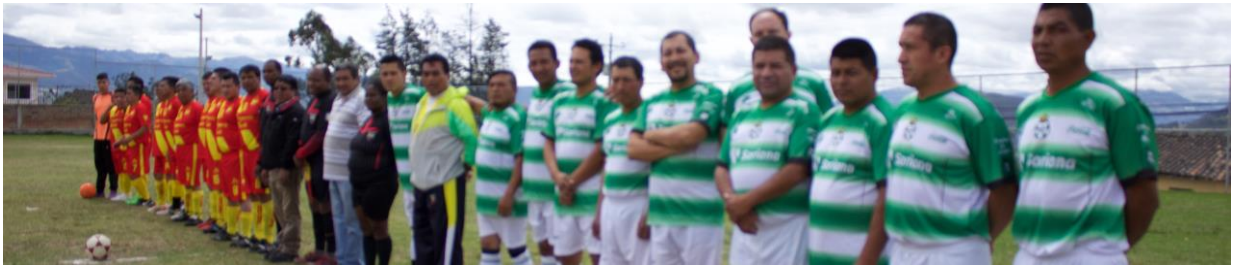
Participación en los sextos juegos interparroquiales, ubicándose en el segundo lugar.

Juegos deportivos con la finalidad de integrar los barrios y comunidades.